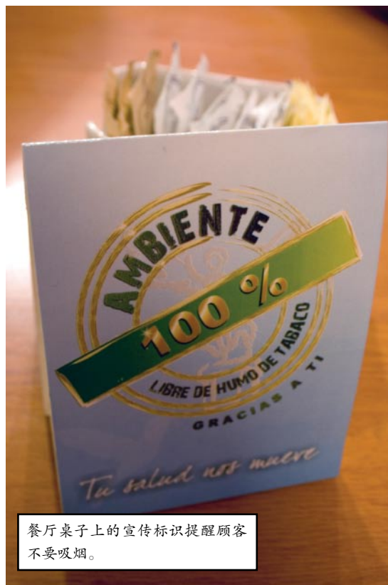
餐厅桌子上的宣传标识提醒顾客不要吸烟。