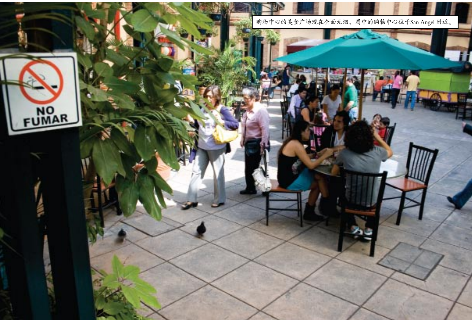
购物中心的美食广场现在全面无烟，图中的购物中心位于San Angel 附近。