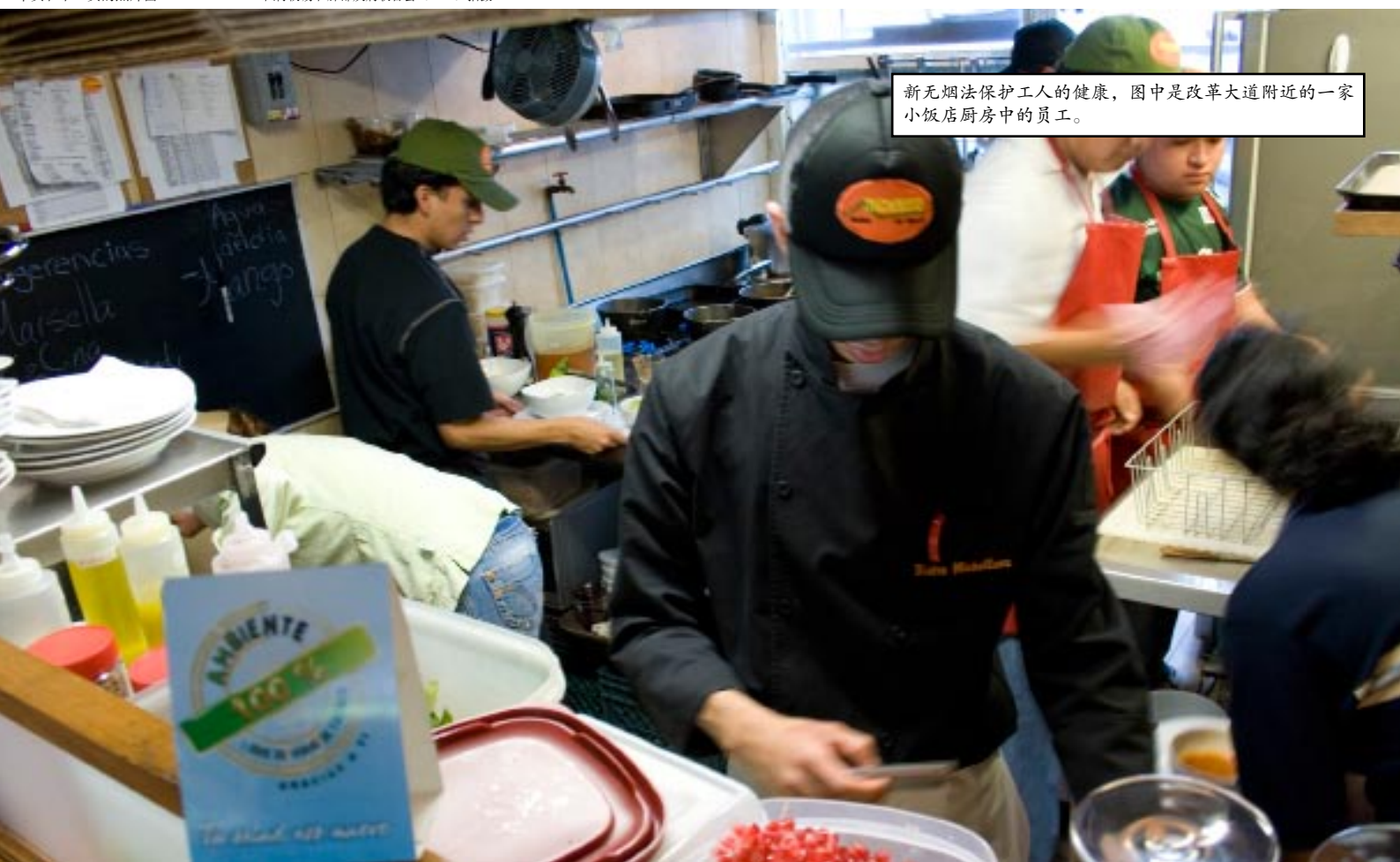
新无烟法保护工人的健康，图中是改革大道附近的一家小饭店厨房中的员工。