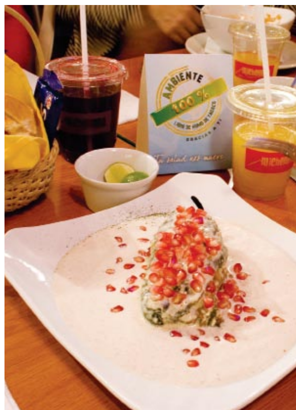
无烟立法实施后在各场所张贴的无烟标识。

在墨西哥城的无烟法获得成功之后，非政府组织还开始在联邦层面推行有效的全面无烟法律。虽然《卫生基本法》原则上允许设立吸烟室，但非政府组织们力图通过在《卫生基本法》中增加限制性的要求和条款，使其变得更严格，并使设立吸烟室变得更困难。