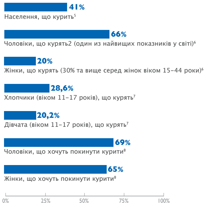
Мал. 1: Вживання тютюнових виробів в Україні (2005)