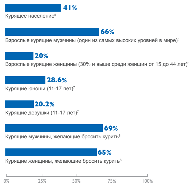
Рисунок 1: Потребление табака на Украине (2005 г.)